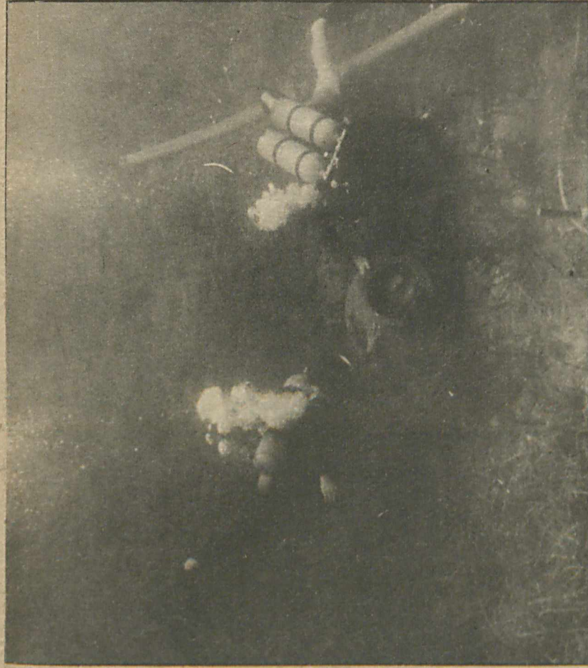
TOPRAK altındaki antik eserler kadar, Ege sahilleri de antik eserler yönünden çok zengin. Birçok amatör balıkadamı, özellikle turizm sezonunda, turist olarak geldikleri ülkemizde izinsiz aramaları yapıp, milyonlarca değerindeki eserleri yurt dışına kaçırıyorlar. Resimde Ege'deki sualtı araştırmalarından bir görünüş...

YARIN: TRUVA'LI HELEN'İN HAZİNESİ KAÇIRILYOR..